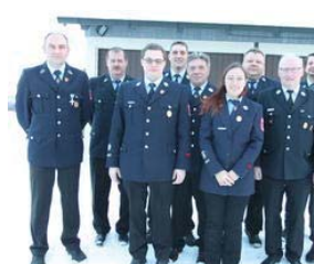
Wieder an einem Strang