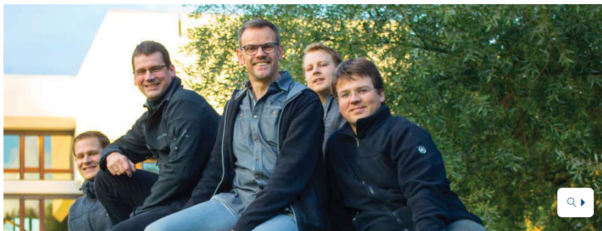
Das Vokalensemble "Bertomijo" ist im kommenden Jahr mit einem neuen Programm unterwegs.